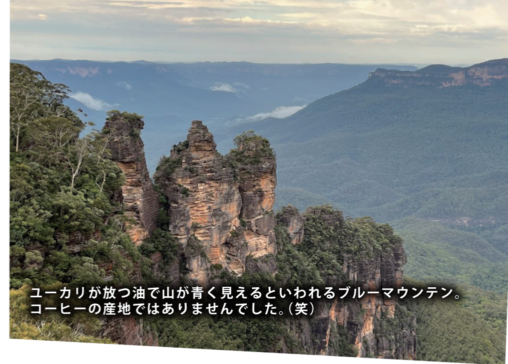
ユーカリが放つ油で山が青く見えるといわれるブルーマウンテン。コーヒーの産地ではありませんでした。(笑)