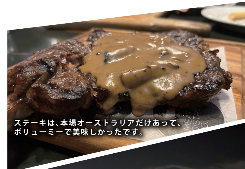
ステーキは、本場オーストラリアだけあって、ボリュームで美味しかったです。