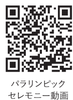
パラリンピック セレモニー動画