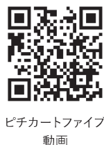
ピチカートファイブ 動画